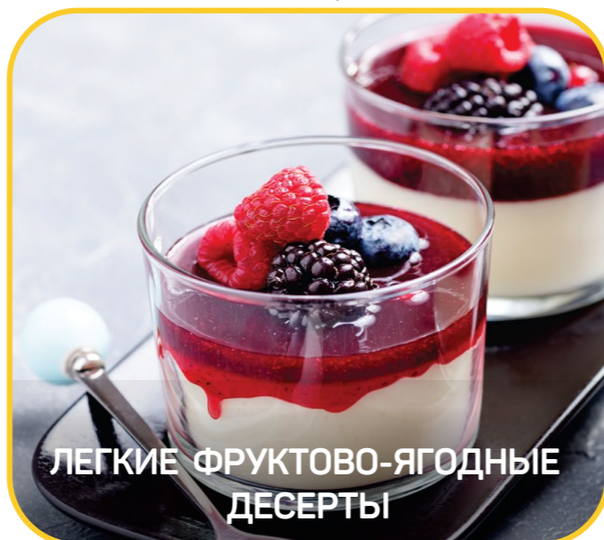
ЛЕГКИЕ ФРУКТОВО-ЯГОДНЫЕ ДЕСЕРТЫ